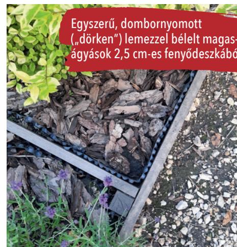
Egyszerű, dombornyomott („dörken”) lemezzel bélelt magasságások 2,5 cm-es fenyődeszkából