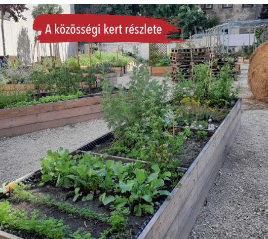
A közösségi kert részlete